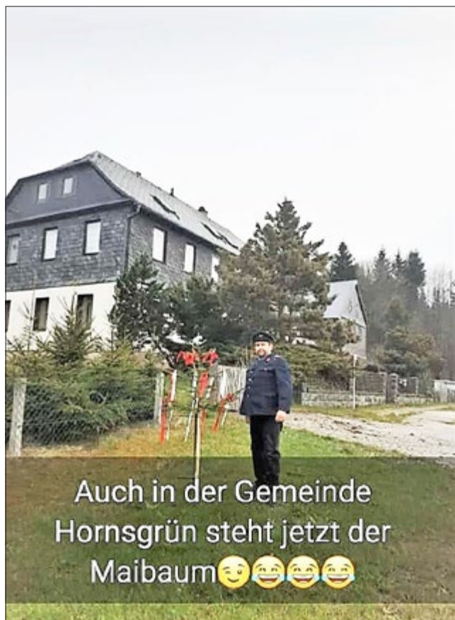
Auch in der Gemeinde Hornsgrün steht jetzt der Maibaum 😊😊😊😊

Dank an alle Kameraden der Freiwilligen Feuerwehr für das coronakonforme Aufstellen der Maibäume in den verschiedenen Ortsteilen der Gemeinde Rosenthal am Rennsteig